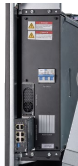
主控、辅源模块热插拔